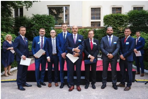
CVCA Slovaca Awards 2023 – vítěz PE Deal Slovensko