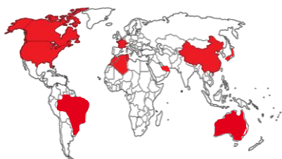
Obrázek č.1 – Distribuční síť

▪ Road-Trace: Vedle dokončení referenční zakázky Sci-Trace® v Q1 2019 se v roce 2019 Společnost věnovala především vývoji zařízení Road-Trace. Společnosti se v tomto projektu podařilo urychlit vývoj a konstrukci prototypu zařízení Road-Trace, přičemž koncept prototypu tohoto zařízení byl již Společností celosvětově představen na jubilejní mezinárodní oborové konferenci EMSLIBS 2019 pořádané v Brně (8.-12. září 2019). Tento projekt je stále ve vývoji i v roce 2020 a jeho uvedení na trh je očekáváno v roce 2020.